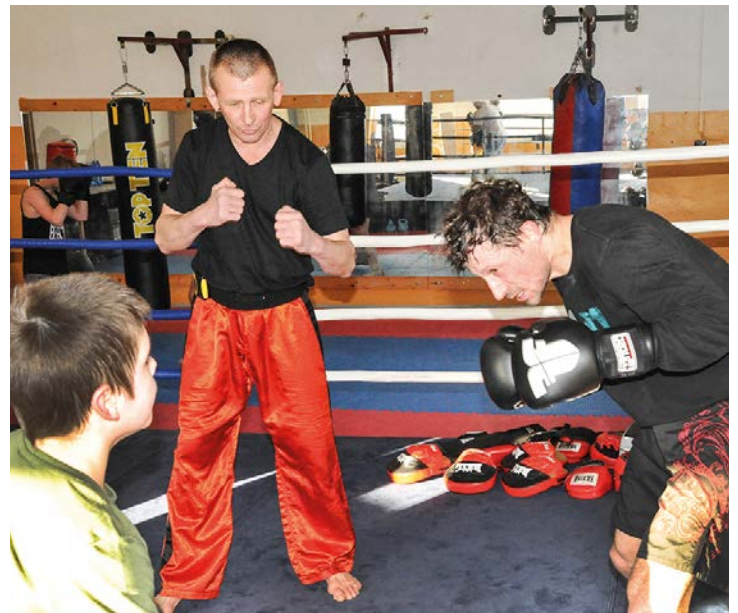
Josef Tarant Kickbox Club Mariánské Lázně.