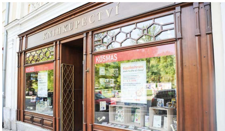
Prostory bývalého knihkupectví se opět zaplnily literaturou.