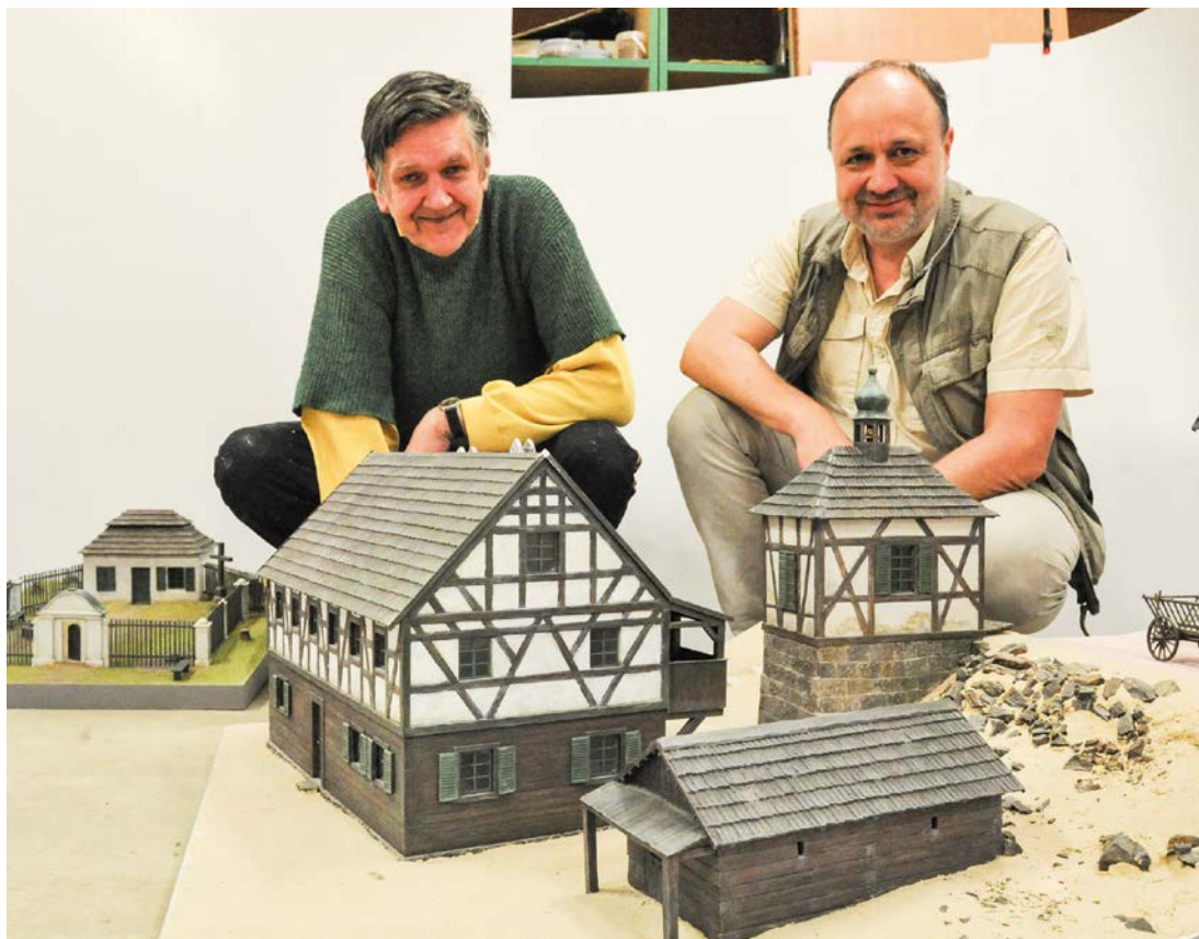
Práce na historickém modelu Mariánských Lázní.

V letošním roce oslaví město 200 let od vyhlášení místa veřejnými lázněmi. Jak Mariánské Lázně vypadaly okolo roku 1815 má u této příležitosti připomenout historický model. Přestože je projekt před dokončením, kdy by se mohl exponát objevit k nahlédnutí v městském muzeu, není známo. Na jeho dokončení chybí finance.