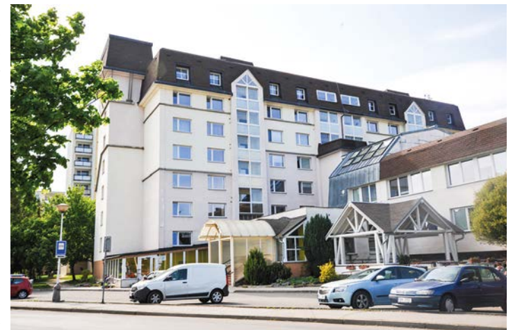
Domov pro seniory a dům s pečovatelskou službou Mariánské Lázně.