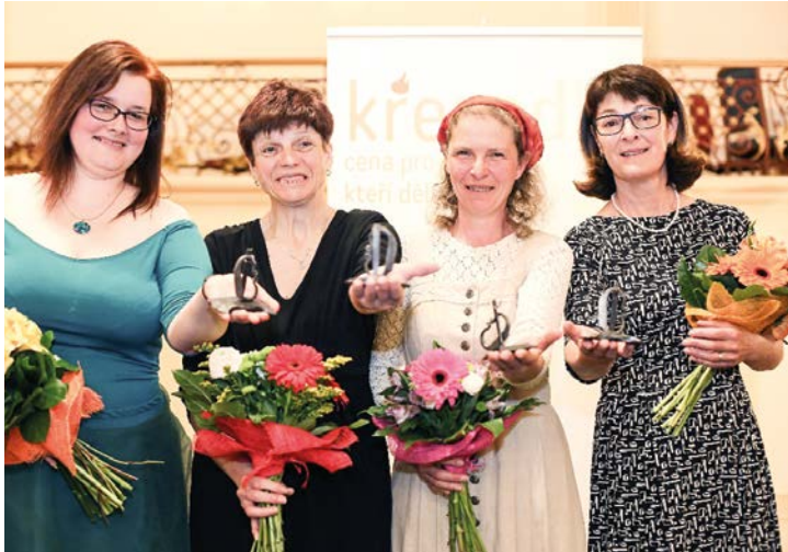
Majitelky Křesadla 2017.

Při slavnostním ceremoniálu byly oceněny 4 dobrovolnice „cenou pro obyčejné lidi, kteří dělají neobyčejné věci“ Křesadlo 2017.