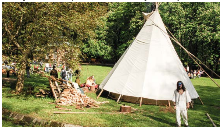
Indiánský den u Prelátova pramene.

Akce pro děti i dospělé plná úkolů, soutěží i legrace. To je Indiánský den, který již mnoho let patří k tradičním předprázdninovým událostem v Mariánských Lázních. Letošní ročník se uskuteční v sobotu 9. června od 13:00 u Prelátova pramene. Stejně jako loni bude připravena stezka pro malé indiány do 7 let i velká stezka pro zdatnější rudé tváře.