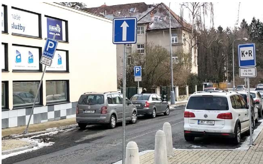
Ilustrační foto. Archiv redakce

Otevřená rezidentní diskriminace v nové zóně D spočívá v administrativním zákazu vydávání rezidentních nebo abonentních parkovacích karet vlastníkům, podnikatelům nebo návštěvníkům města s odvoláním na skutečnost, že tyto občané nebydlí trvale v Mariánských Lázních, přestože jsou trvalými rezidenty v dané zóně i desítky let. Proto petiční výbor podporuje a souhlasí s návrhem ostatních subjektů