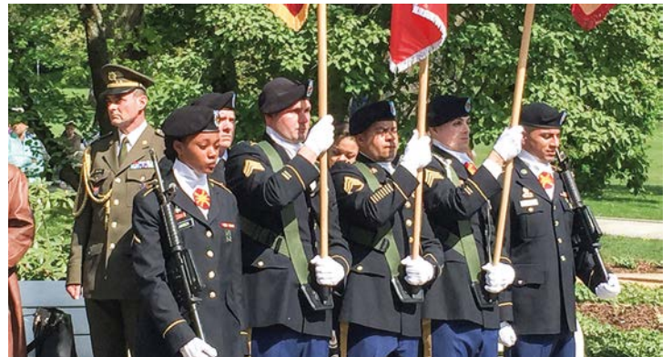
Příslušníci americké armády.