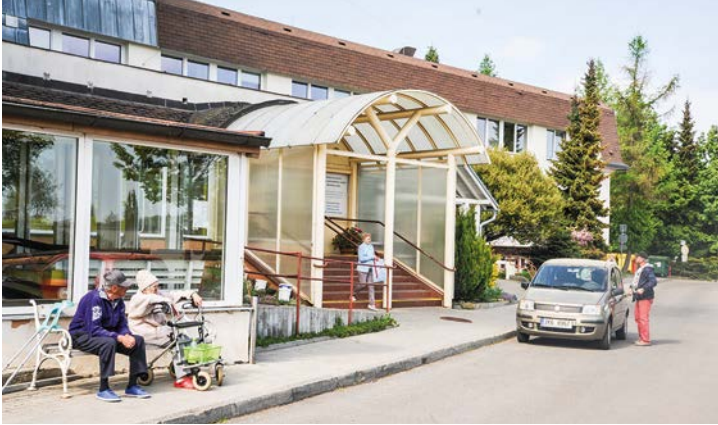
Domov pro seniory a dům s pečovatelskou službou Mariánské Lázně.

Dlouhé čekací doby na umístění do pobytových sociálních zařízení, ale i měnící se trendy v oblasti sociálních služeb. I z těchto důvodů bude lázeňský Domov pro seniory pořádat kurz sdílené péče pro veřejnost.