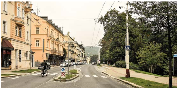
Snímek ze stejného místa z éry tramvaje neexistuje, takže jsme přeskočili do roku 2017. Vzhled domů se příliš změnil. Náhodný cyklista sjel z Ruské a jede v protisměru.