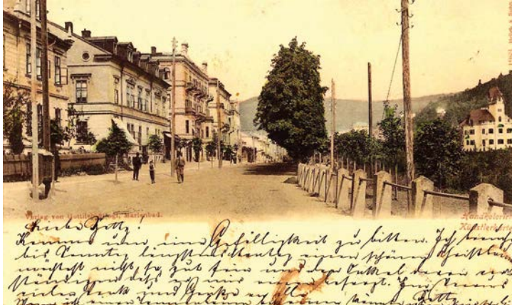
Pohlednice je nejspíš z roku 1900. Svah vpravo dolů je asi částečný návoz, má ještě málo stromů. (Sbírka Václav Kohout)