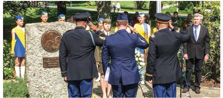
Zástupci americké ambasády a armády USA vzdávají hold u pomníku generála Pattona.

Za přítomnosti členů vedení Mariánských Lázní, zástupců americké ambasády, partnerského města Weiden a armád České republiky a USA proběhl slavnostní akt, který připomněl, že před 73 lety skončila krvavá 2. světová válka. A byla to právě americká armáda, která Mariánské Lázně osvobodila. Vzpomínková událost proběhla 4. května u pomníku generála George Pattona.